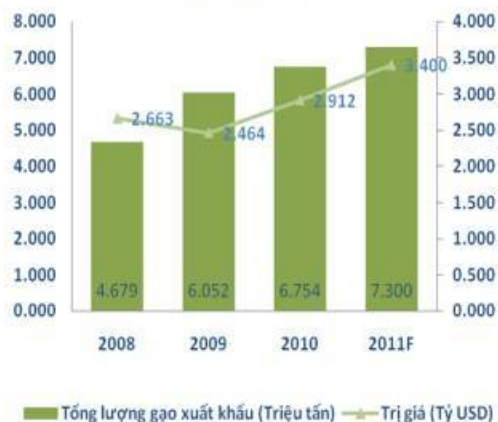
Tổng sản lượng xuất khẩu gạo của Việt Nam qua các năm