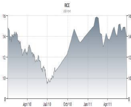
Diễn biến giá gạo 2010 - 2011