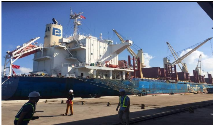
Hình 01. Cảng Dung Quất 200k-DWT