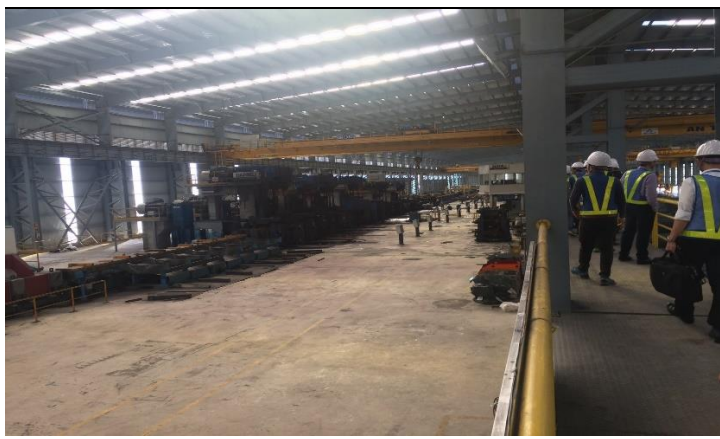
Hình 05. Nhà máy cán thép