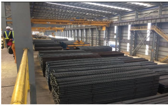
Hình 06. Thành phẩm thép thanh