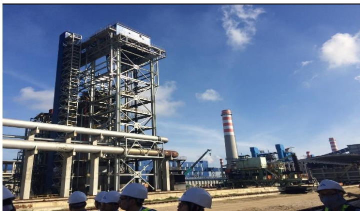
Hình 03. Dập than cốc khô