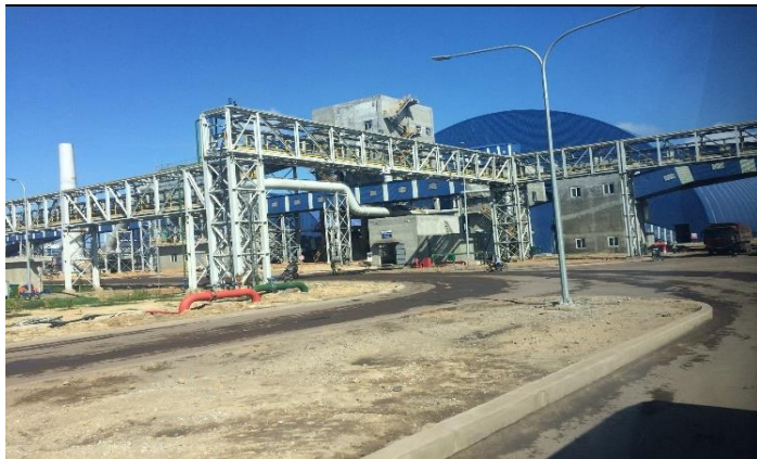
Hình 02. Kho chứa nguyên vật liệu