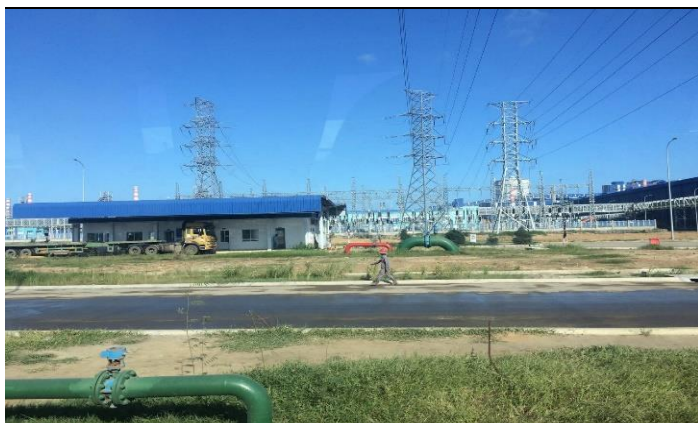
Hình 04. Trạm điện 110KV