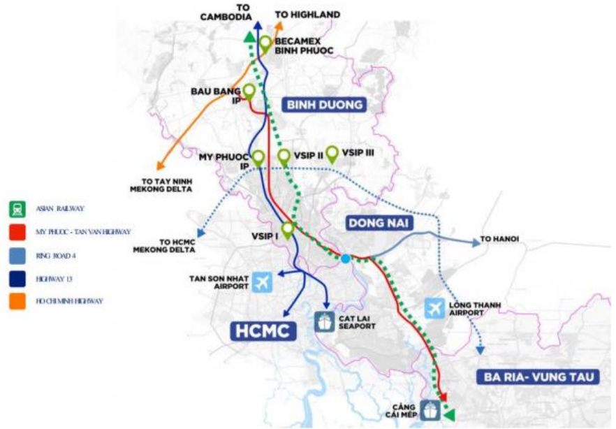
Hình ảnh 1. Bản đồ vị trí các khu công nghiệp của Becamex