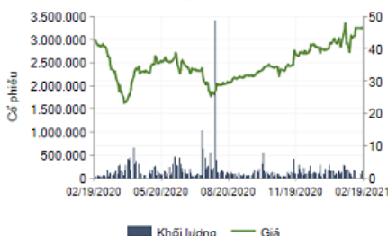
1 Năm; Giá và Khối lượng