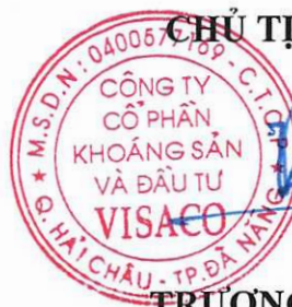
TRƯƠNG THẾ SƠN