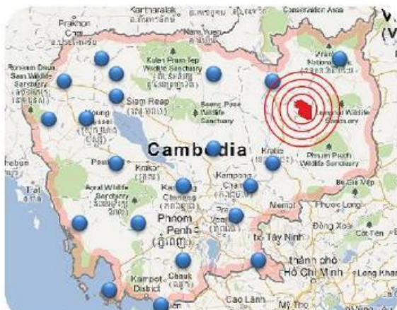
Vị trí dự án Cao su - Campuchia

Màng Trồng rừng Dự án trồng cao su ở Campuchia với tổng diện tích đất khoảng 30,000ha liền thửa bắt đầu khai hoang trồng mới từ năm 2011. Cuối năm 2013, diện tích trong trồng cây cao su đã đạt 5,500 ha và dự kiến đến năm 2014 diện tích đất khai hoang và đất trồng cao su sẽ là 9,800ha và 7,500ha. Theo kế hoạch dự án, mỗi năm GMD sẽ trồng thêm 2,000ha cây cao su và đến năm 2017, diện tích 500ha cao su trồng đầu tiên sẽ được đưa vào khai thác mang về dòng tiền cho công ty.