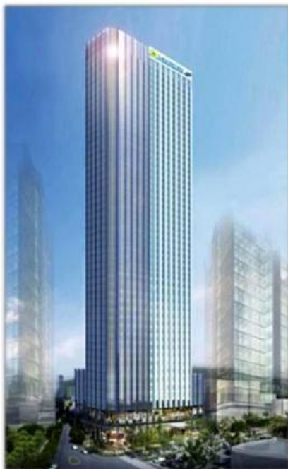
Dự án Saigon Gem