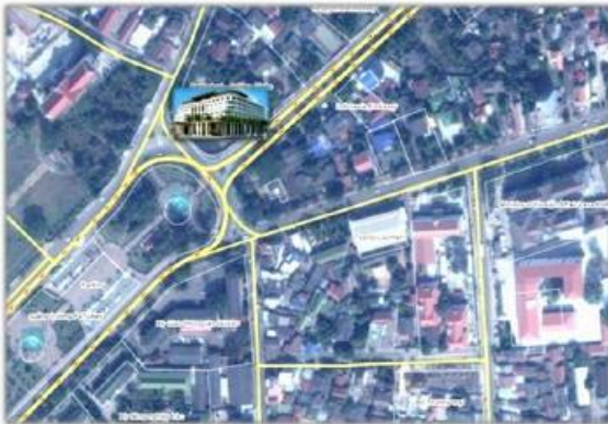
Vị trí Dự án Viên Chăn - Lào