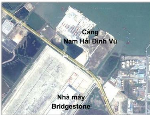
Vị trí Cảng Nam Hải Đình Vũ