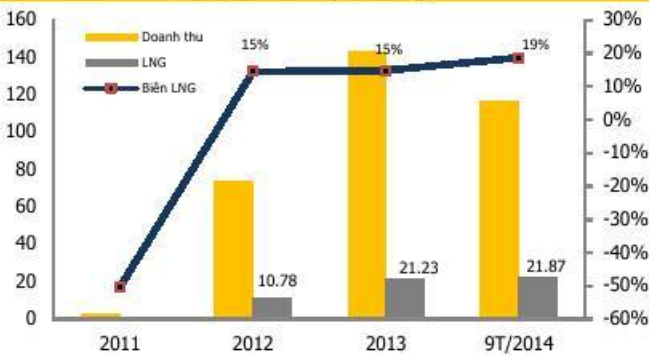
KQKD của PVP qua các năm (tỷ đồng)