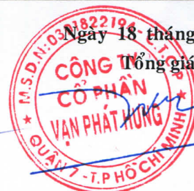
TRƯƠNG THÀNH NHÂN